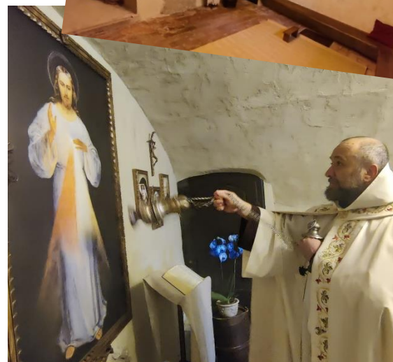
La benedizione del quadro del Gesù Misericordioso e della nuova cappella dedicata alla Divina Misericordia