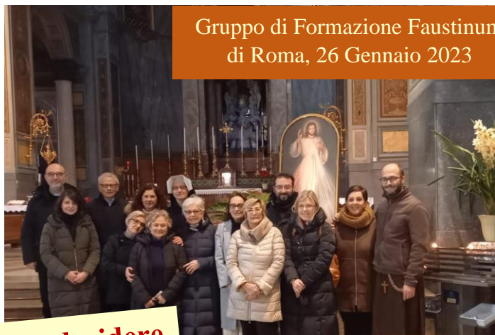
Gruppo di Formazione Faustinum di Roma, 26 Gennaio 2023