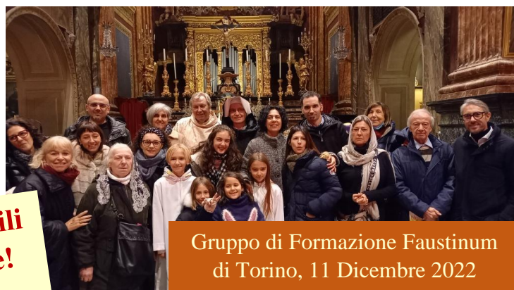
Gruppo di Formazione Faustinum di Torino, 11 Dicembre 2022