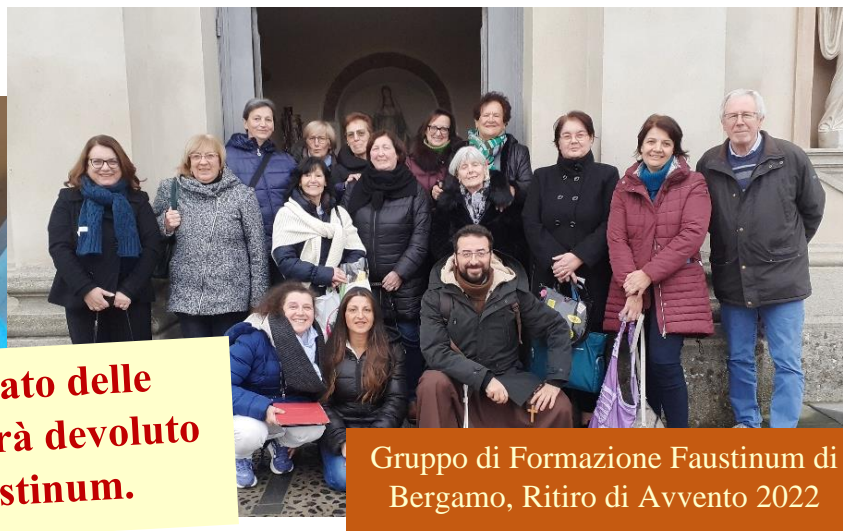
Gruppo di Formazione Faustinum di Bergamo, Ritiro di Avvento 2022

Il ricavato delle offerte sar  devoluto a Faustinum.