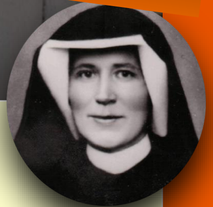
Mastewal Martella Volontario Faustinum di Lecce